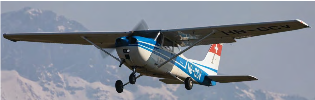
Cessna 172 HB-CCV