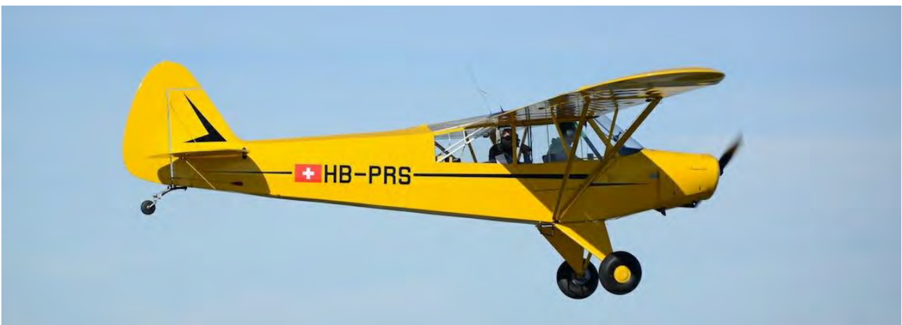
Piper PA-18 HB-PRS.

Construit à près de 11'000 exemplaires toutes versions confondues, le PA-18 Super Cub permet d'acquérir des compétences de pilotage, notamment à l'atterrissage, que peu d'autres avions peuvent offrir. Il est le représentant d'une aviation qui procure le plaisir du pilotage pur, élémentaire et exigeant, totalement dans l'esprit des valeurs défendues par AéroFormation.