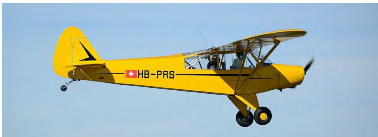
Piper PA-18 HB-PRS.

Construit à près de 11'000 exemplaires toutes versions confondues, le PA-18 Super Cub permet d'acquérir des compétences de pilotage, notamment à l'atterrissage, que peu d'autres avions peuvent offrir. Il est le représentant d'une aviation qui procure le plaisir du pilotage pur, élémentaire et exigeant, totalement dans l'esprit des valeurs défendues par AéroFormation.