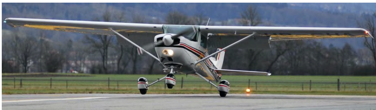
Cessna 152 HB-CHA

AéroFormation opère deux Cessna 152 quasiment identiques, ce qui offre une grande flexibilité dans l'organisation du programme des vols.