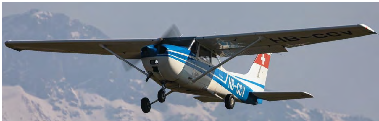
Cessna 172 HB-CCV