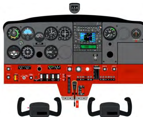
Tableau de bord HB-CHV