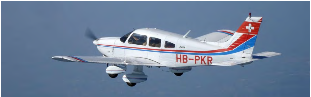
Piper PA-28-181 Archer II HB-PKR

Dans sa version Archer II , ce modèle de PA-28 est l'un des monomoteurs de sa catégorie qui propose le meilleur rapport puissance/performances et permet la plus grande charge utile.