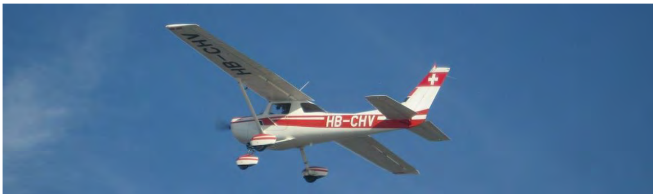
Cessna 152 HB-CHV

Le Cessna 152 est une évolution du Cessna 150 produite à plus de 7500 exemplaires. Son moteur légèrement plus puissant et quelques améliorations aérodynamiques lui confèrent des performances supérieures tout en conservant les remarquables qualités de vol du C150. Les élèves passent de l'un à l'autre sans difficulté durant la formation.