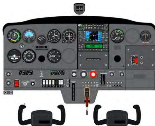
Tableau de bord HB-CHA

AéroFormation opère deux Cessna 152 quasiment identiques, ce qui offre une grande flexibilité dans l'organisation du programme des vols.