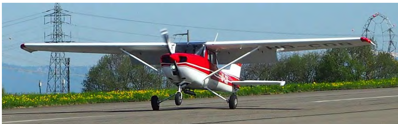
Cessna 150 HB-CDB

Produit à plus de 23'000 exemplaires, le Cessna 150 a sans doute vu défiler à son bord plus d'élèves pilotes à travers le Monde qu'aucun autre appareil de sa catégorie. Ses qualités de vol homogènes et équilibrées en font, encore aujourd'hui, un des meilleurs avions pour l'apprentissage du pilotage de base.