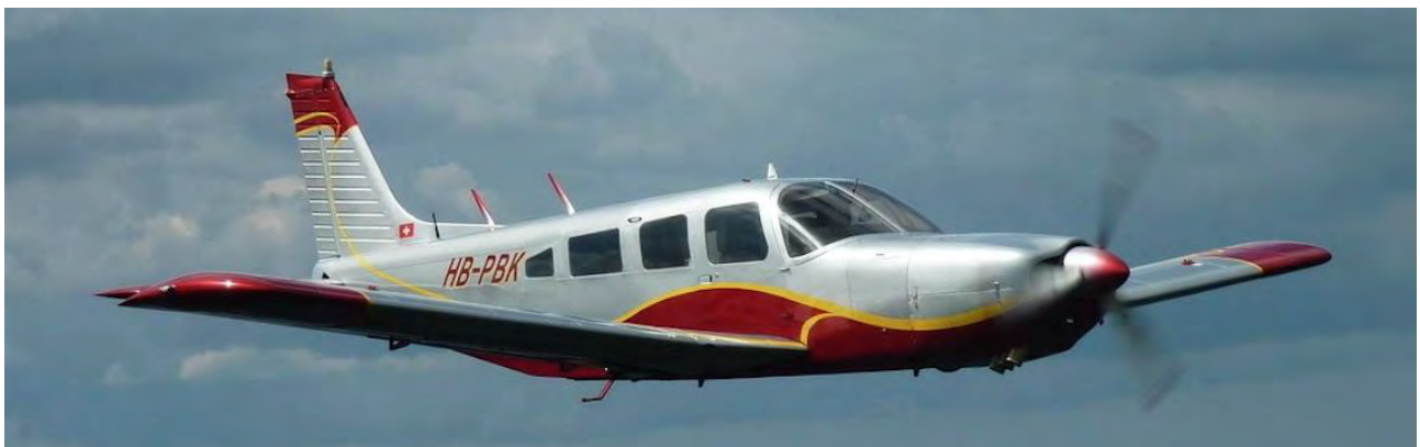
Piper PA-32R-300 Lance HB-PBK

Développée à partir du Piper PA-28, la série des PA-32 incorpore, dans sa version Cherokee Lance , un moteur de 300 HP équipé d'une hélice à pas variable et un train d'atterrissage escamotable. Ses performances de croisière (150 KTS), sa capacité d'emport et son instrumentation complète (VFR/IFR) en font un avion de voyage rapide et confortable.